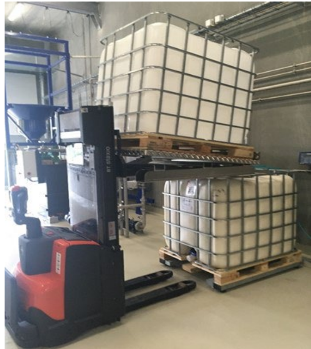
BM-Tilt håndteret med stabler