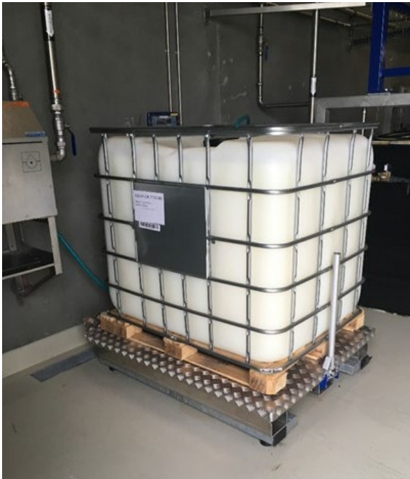
BM-Tilt med palletank