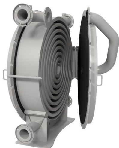
Veksler med åbent låg