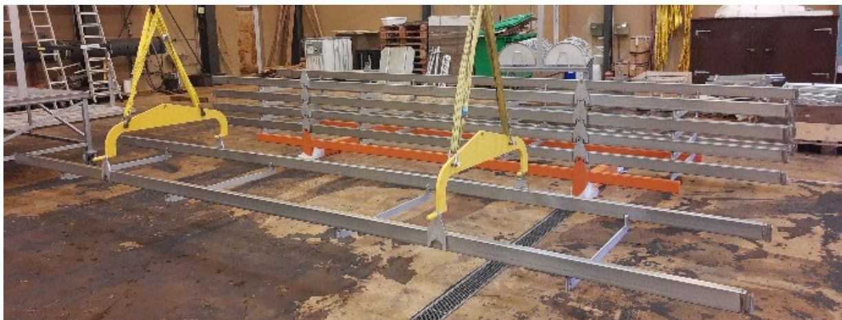
En ramme bliver løftet