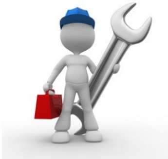
BM Montage, supervision, service