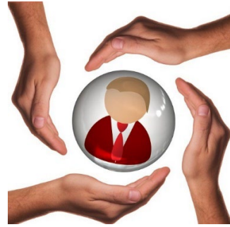
BM Customer-Supplier Relations