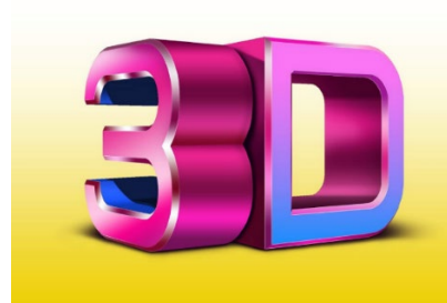
BM 3D modellering og print