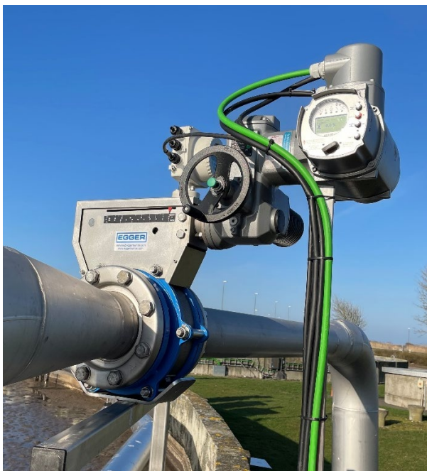
Iris ventil monteret på Nakskov RA

Vedligeholdelsesfri Iris ventil leveres med spindel i syrefast stål samt spindelmøtrik i kompositmaterialet PEEK.