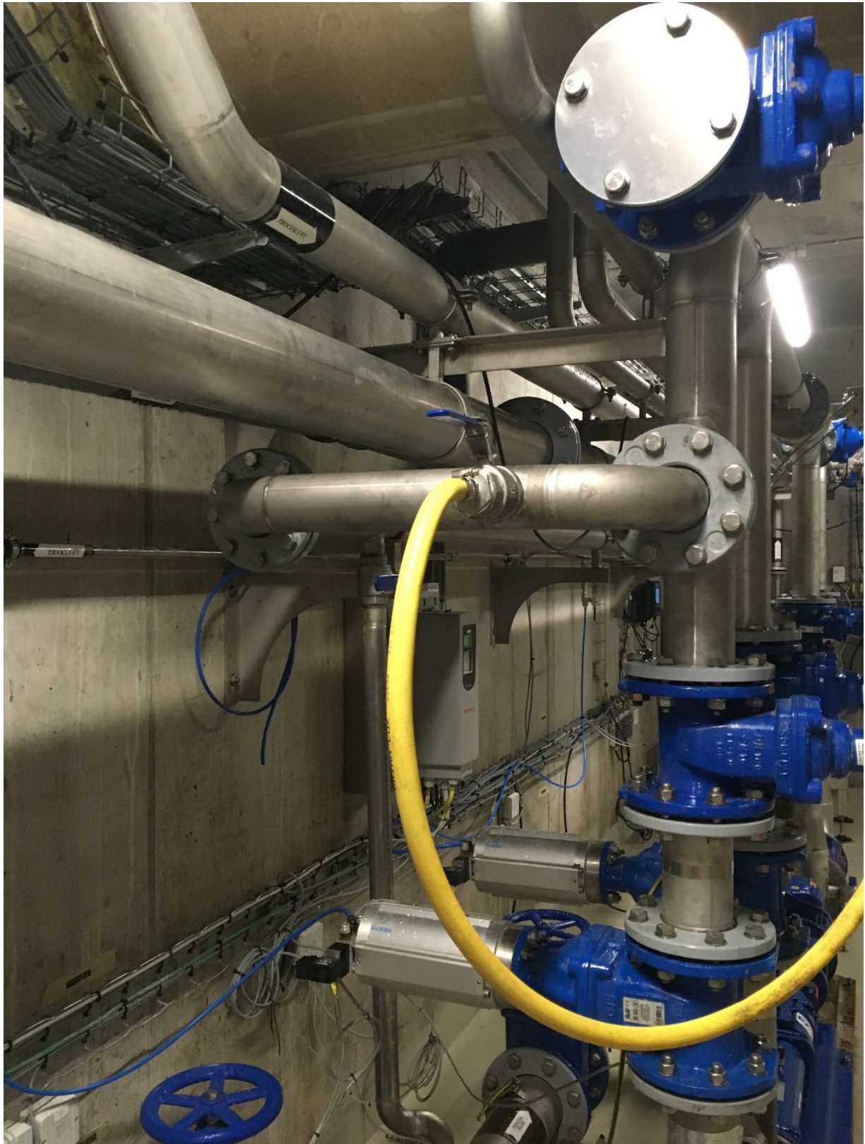
Nyt rørsystem til pumpning af primærslam (fra Salsnes filtre)