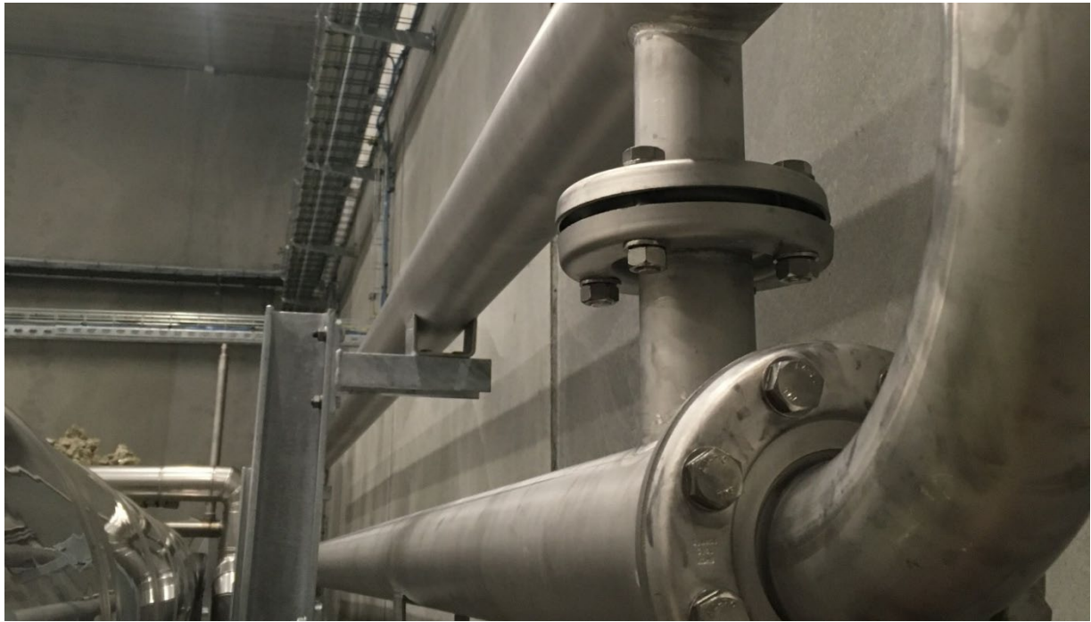
Ekstra slam/vand veksler (BioMizing BM-PPH)