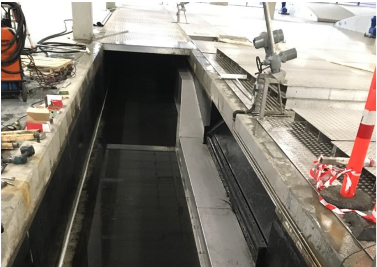
Ombygning af returslamføring i tilløbskanal