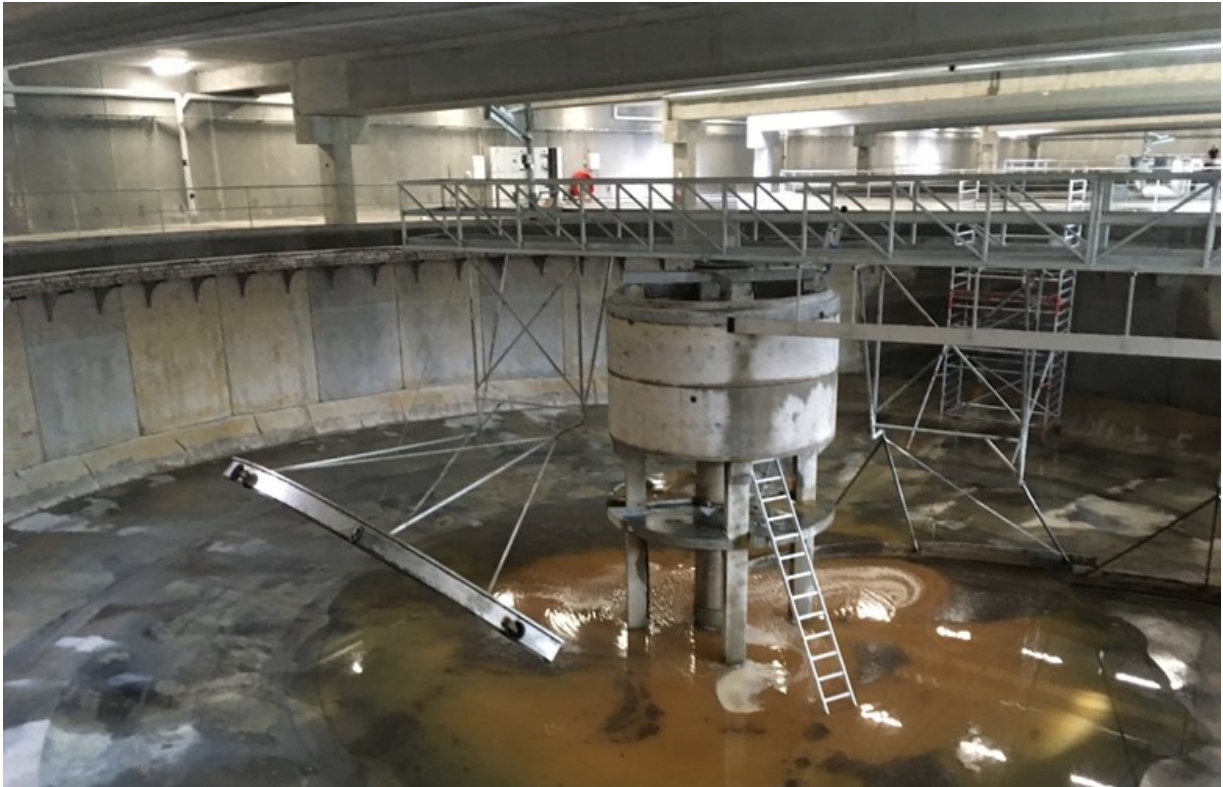
Ombygning af efterklaringstanke, med nye flydeslamskrabere samt udtag